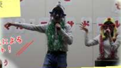
♪林檎殺人事件 (郷ひろみ・樹木希林)