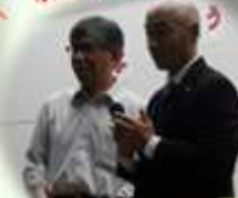
♪世界ひとつだけの花 (SMAP)