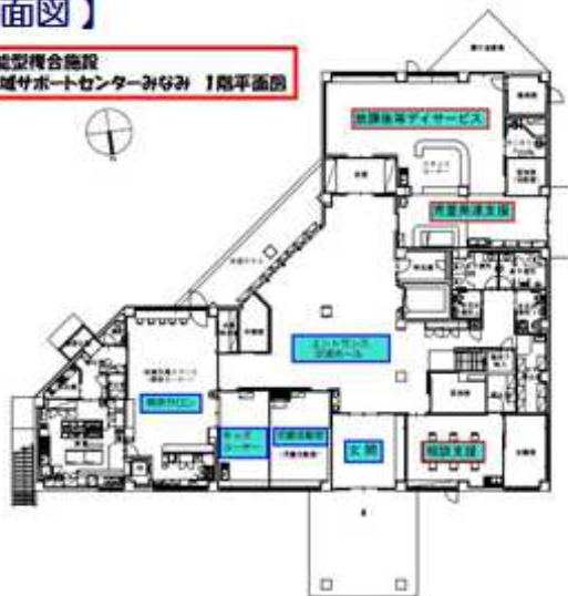
多機能型複合施設 地域サポートセンターみなみ 1階平面図