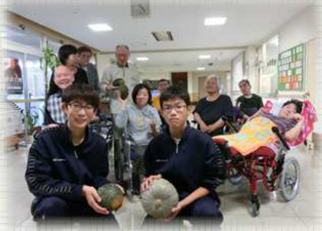
大きなカボチャを持って西部中学校のみなさんと。

今年も年男・年女の皆さまにご協力いただき、笑顔あふれる素敵な表紙ができました。これからも、行事写真の掲載、また、事業内容等、紙面にてご報告させていただきます。まだまだ寒い日が続きますが、お身体を大切にお過ごしください。今年もどうぞよろしく願いいたします。次号は、9月1日発行予定です。