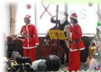
北広島ジャズクラブ様

今回の会食会も2回に分けての実施になりました。ゲストの“北広島ジャズクラブ”さんの生演奏を聴きながらのお食事や利用者様によるカラオケ、職員によるバルーンアート等で盛り上がりました。楽しい空間で1年を振り返ることが出来ました。