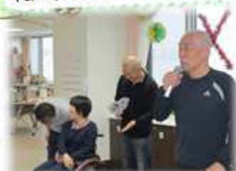
利用者様によるカラオケ