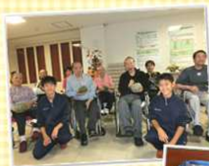
▲西部中学校のみなさんと。